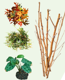
RECORTES DE PLANTA