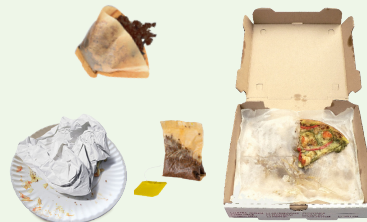
PAPEL SUCIO SIN FORRO

A partir del 1 de enero de 2022, los residentes y las empresas ahora deben compostar materiales orgánicos en el sitio o a través de su contenedor de compost verde Recology.