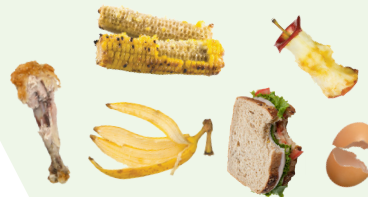
RESTOS DE COMIDA

ESTOS ARTÍCULOS SE PUEDEN COLOCAR EN SU CARRITO VERDE.