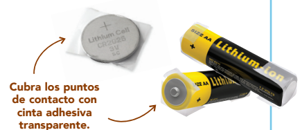
Cubra los puntos de contacto con cinta adhesiva transparente.