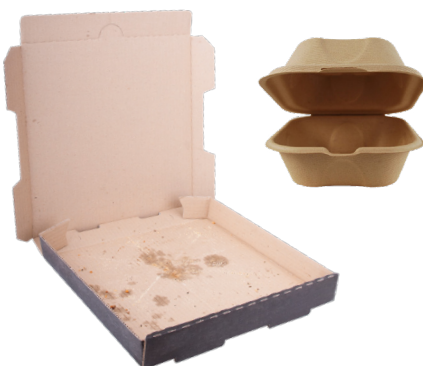
WALANG BALOT NA MARUMING PAPEL