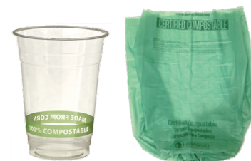
MGA ORGANIKONG PLASTIK