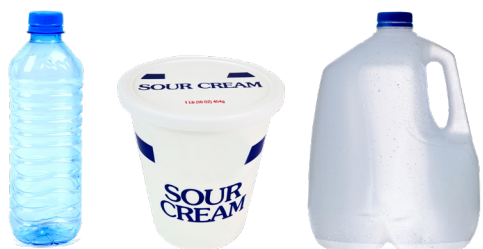
MGA PLASTIC NA BOTE, TUB, AT JUG