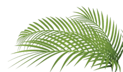
MGA OLEANDER AT DAHON NG PALMA