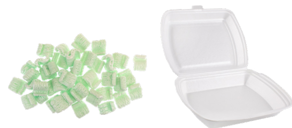
PAMBALOT NA FOAM AT POLYSTYRENE