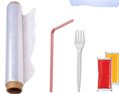
ISAHANG-GAMIT NA PLASTIK