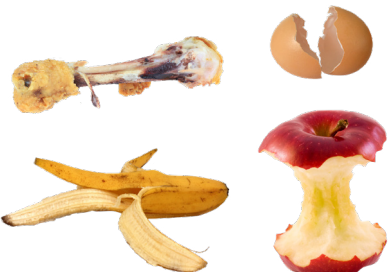
MGA TIRANG PAGKAIN