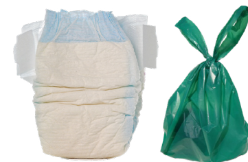
MGA DIAPER AT DUMI NG ALAGANG HAYOP