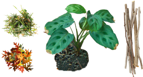
BASURA MULA SA BAKURAN