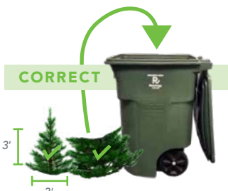
CUT TREE TO FIT