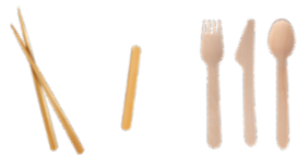
CHOPSTICKS, STIR STICKS, AND WOODEN UTENSILS PALILLOS MESCCLADORES, PALILLOS Y UTENSILIOS DE MADERA