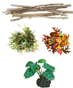
PLANT TRIMMINGS DESECHOS DE JARDÍN