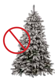
NO FLOCKED TREES

Entrega disponible: del 26 de Diciembre al 12 de Enero en la estación de bomberos de Point Reyes (calles 4 y B), la estación de bomberos de Tomales (599 Dillon Beach Rd) y la estación de bomberos de Woodacre (33 Castle Rock Rd). Los paquetes también se pueden cortar para que quepan dentro de su carrito verde, con la tapa cerrada, para recogerlos en cualquiera de sus días habituales de servicio.