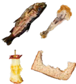
FOOD SCRAPS RESTOS DE COMIDA