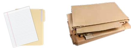
PAPER, FLATTENED CARDBOARD, AND CARTONS PAPEL, CARTÓN PLANO Y CARTONES

ANSWERS: 1. Compostable cup = Trash, 2. Soiled paper plate and napkin = Compost, 3. Plastic package = Recycling