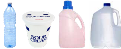
PLASTIC BOTTLES, TUBS, AND JUGS BOTELLAS, BALDES Y JARRAS DE PLÁSTICO