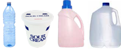
PLASTIC BOTTLES, TUBS, AND JUGS BOTELLAS, BALDES Y JARRAS DE PLÁSTICO