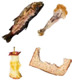
FOOD SCRAPS RESTOS DE COMIDA