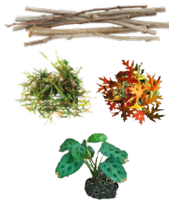
PLANT TRIMMINGS DESECHOS DE JARDÍN