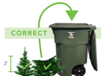
CUT TREE TO FIT