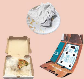
ਲਿਬੜਿਆ ਕਾਗਜ਼ ਅਤੇ ਵੈਕਸ ਵਾਲਾ ਗੱਤਾ