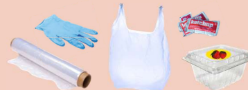
ਇੱਕ ਵਾਰ ਵਰਤਣ ਵਾਲਾ ਪਲਾਸਟਿਕ