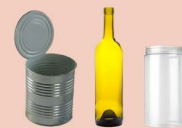
ਰੀਸਾਈਕਲਿ ਹੋਣ ਯੋਗ ਵਸਤਾਂ