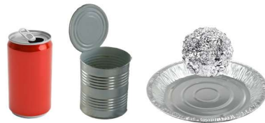
ਧਾਤੂ ਦੇ ਡੱਬੇ ਅਤੇ ਢੱਕਣ, ਸਾਫ਼ ਫੋਏਲ