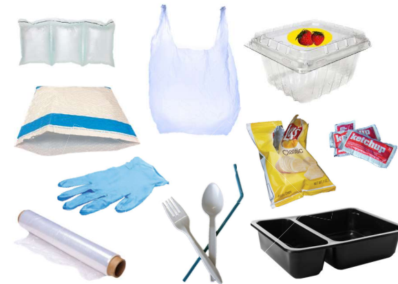
ਪਲਾਸਟਿਕ ਦੀ ਪੈਕੇਜਿੰਗ, ਇੱਕ-ਵਾਰ ਵਰਤਣ ਵਾਲਾ ਅਤੇ ਕਾਲਾ ਪਲਾਸਟਿਕ