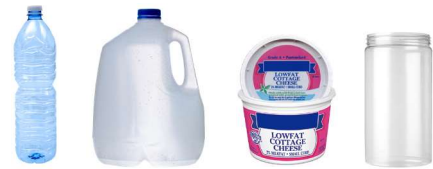
ਪਲਾਸਟਿਕ ਦੀਆਂ ਬੋਤਲਾਂ, ਟੱਬ, ਜੱਗ, ਅਤੇ ਜਾਰ