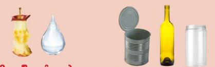
ਭੋਜਨ ਦੀ ਰਹਿੰਦੂ-ਖੁੰਹਦ ਅਤੇ ਤਰਲ