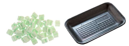
ਪੈਕੇਜਿੰਗ ਅਤੇ ਪੋਲੀਸਟਰਿਨ ਫੋਮ