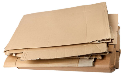
ਸਪਾਟ ਕੀਤਾ ਗੱਤਾ