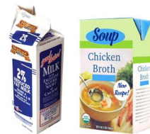
ਗੱਤੇ ਦਾ ਡੱਬਾ