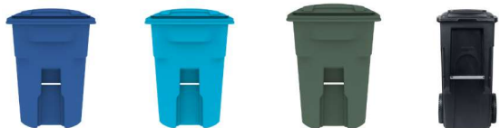
ਕਾਰਗਜ਼ ਅਤੇ ਗੱਤੇ ਨੂੰ ਰੀਸਾਈਕਲ ਕਰਨਾ ਕੰਟੇਨਰ ਨੂੰ ਰੀਸਾਈਕਲ ਕਰਨਾ ਖਾਦ ਰੱਦੀ