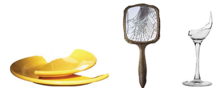
ਸਿਰੇਮਿਕ ਅਤੇ ਕੱਚ ਦਾ ਸਾਮਾਨ