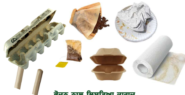
ਭੋਜਨ ਨਾਲ ਲਿਬੜਿਆ ਕਾਗਜ਼