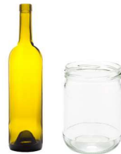
ਕੱਚ ਦੀਆਂ ਬੋਤਲਾਂ ਅਤੇ ਜਾਰ