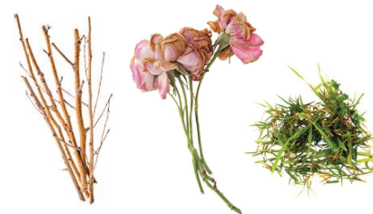
ਪੌਦੇ ਅਤੇ ਵਾੜੀ ਦੀ ਵਾਢੀ