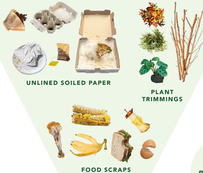
UNLINED SOILED PAPER

Effective January 1, 2022, residents and businesses are now required to compost organic materials on site or through their green Recology compost bin.