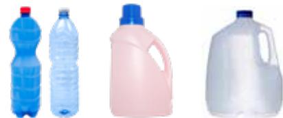
PLASTIC BOTTLES, TUBS, AND JUGS BOTELLAS, BALDES Y JARRAS DE PLÁSTICO