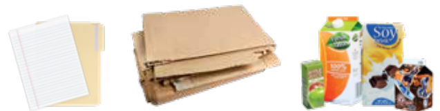
PAPER, FLATTENED CARDBOARD, AND CARTONS PAPEL, CARTÓN PLANO Y CARTONES

Don't know where something goes? ¿No sabes en dónde van las cosas?