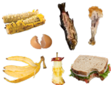
FOOD SCRAPS RESTOS DE COMIDA