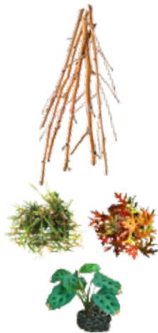
PLANT TRIMMINGS DESECHOS DE JARDÍN