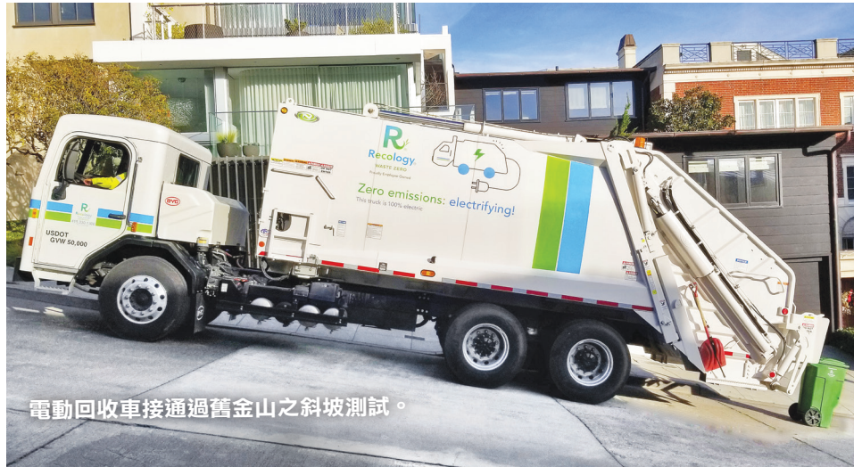
電動回收車接通過舊金山之斜坡測試。

Recology 現在正在測試後載電動回收車。我們成功地展示了它們能夠爬上我們城市的斜坡，現在我們正在測試他們在其他城市的表現。