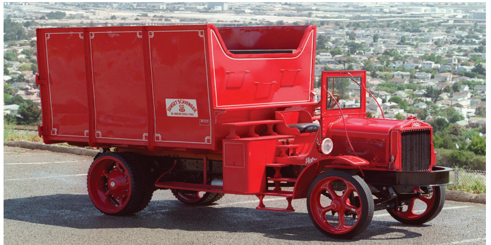
經典卡車「大紅車 (Big Red)」，是 Recology 早期收垃圾清運員所使用的款式。

雖然在過去的一個世紀裡，清運作業的方式早已改變，但 Recology 的持股員工們仍然每天在舊金山的大街小巷與繁忙的碼頭中穿梭著。我們的工作讓我們與我們所服務的社區更加貼近，並提讓我們與客戶一起學習和成長的獨特機會。