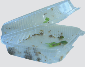
खाने से गन्दा प्लास्टिक