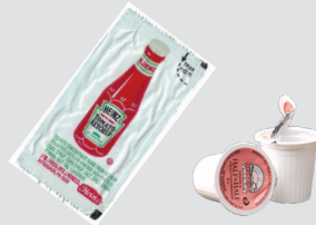
मसाले के पैकेज