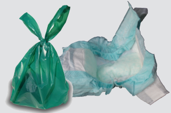
डायपर, पालतू जानवर से सम्बंधित कचरा और कटी पार्टी का कूड़ा (थैले में बंद)