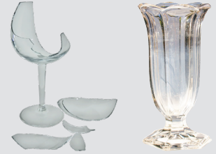
सरिमकि और कांच से बने सामान (टूटे हुए या अनुपयोगी)