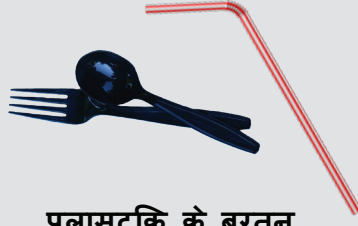
प्लास्टिक के बर्तन