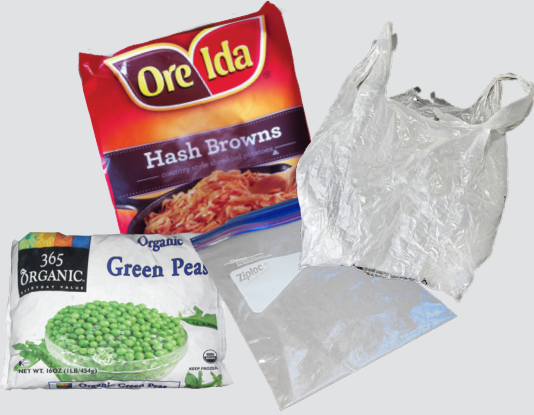
खुले प्लास्टिक के बैग